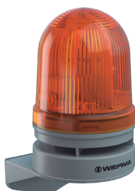
Con accesorio 261 700 07