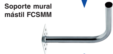
Soporte mural mástil FCMM