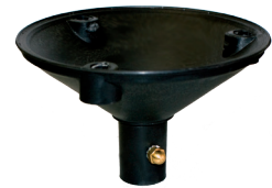
Soporte tubo/pie P5934