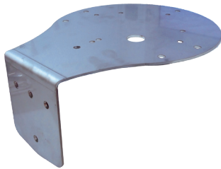
Soporte mural FCSM165227