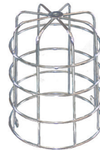
Jaula de protección P5200