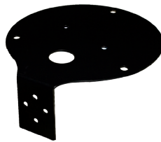
Soporte mural FCSM150