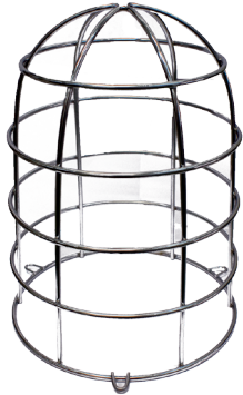
Jaula de protección antivandálica FCJP150