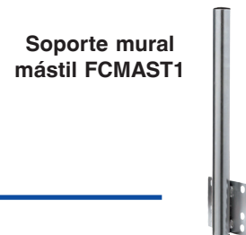
Soporte mural mástil FCMAS1