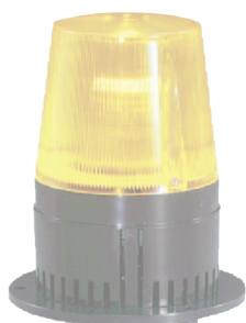
SONOLAMP 59 LAMP 59